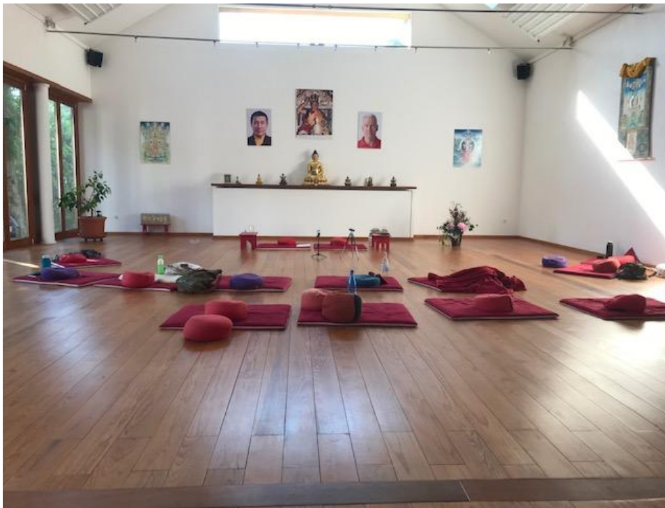
Blick in die Gompa