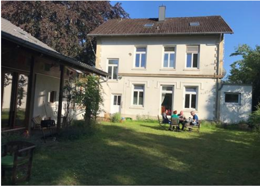
Rückansicht auf das Wohnhaus, links befindet sich der Laubengang vor der Gompa